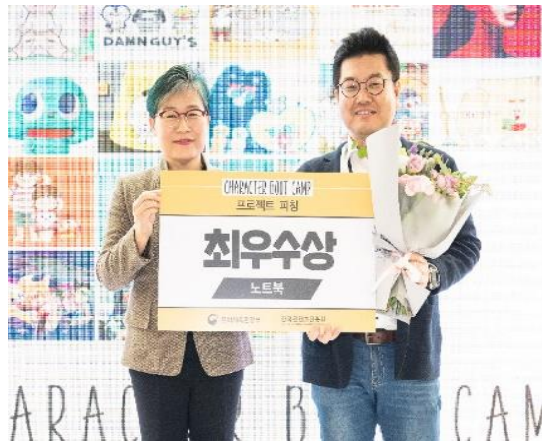
- 2019 Best Award, Popular Award