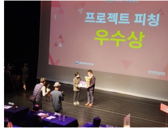
- 2020 excellence award, Popular Award